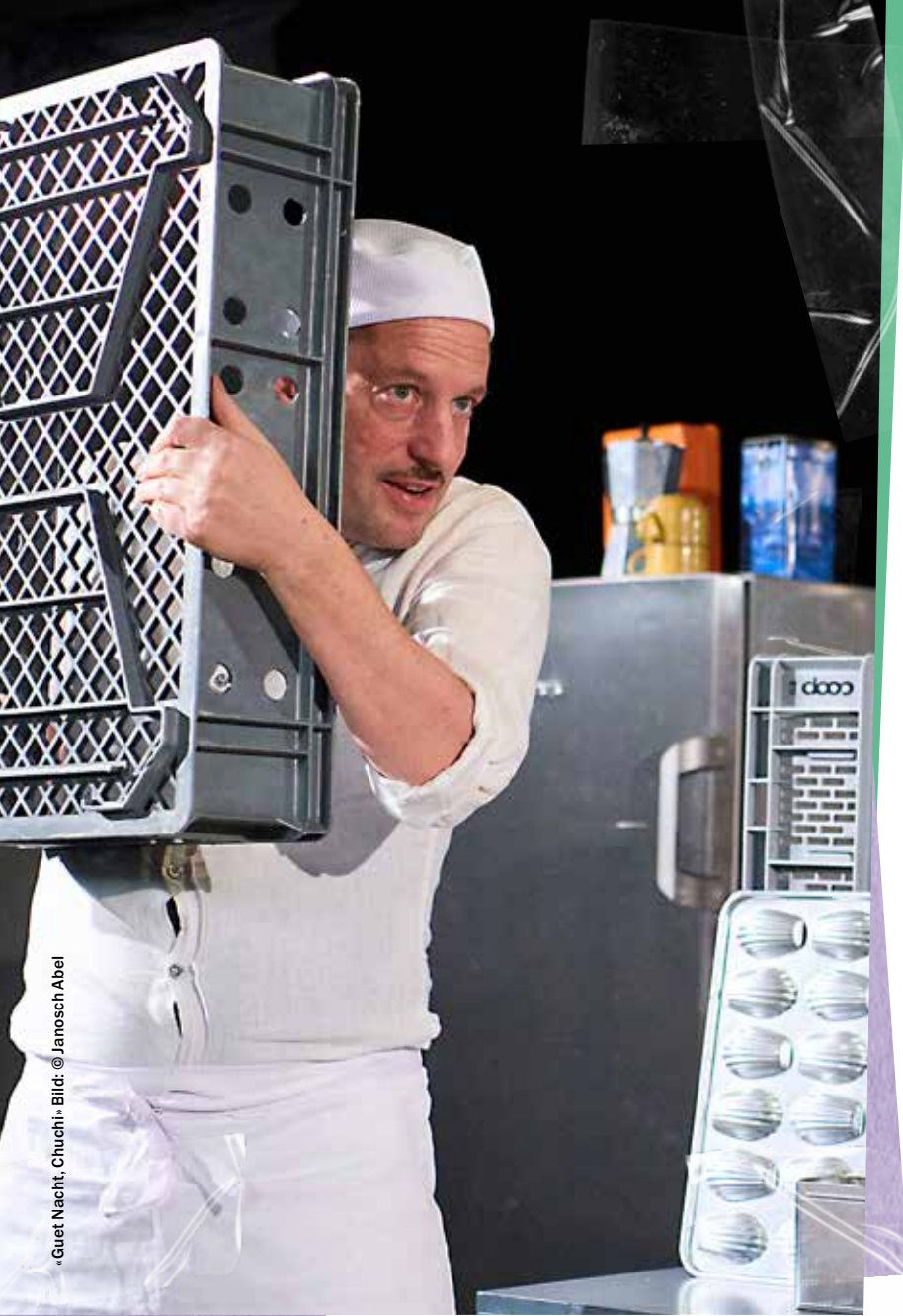
«Guet Nacht, Chuchi»

Eine abenteuerliche Nacht in der Backstube.